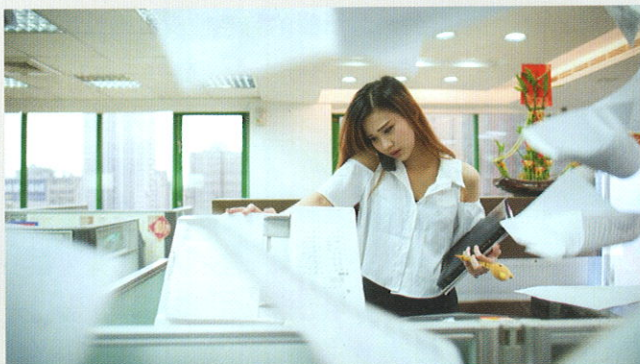
■ 現代婦女須兼顧家庭和事業，焦慮抑鬱的情緒易引起不孕。

從中醫角度看，生理功能的物質基礎是氣、血、精、髓，其正常與否有賴於各個臟腑的功能協調。中醫認為腦為元神之府，其生理和病理統歸於心而分屬五臟：「心者，五臟六腑之大主也，精神之所舍也。」顯示人的精神意識和思維活動統歸於心（涵蓋腦）。心火上注於腦，心神有病可損及腦；肝失疏泄，氣機失調同樣也傷於腦；憂愁不解，脾氣鬱滯，運化失司，精微不能上輸於腦而腦髓失養；腎藏精生髓，腎傷精虧則腦髓不足；可見臟器病變常可損及腦，而情志的最後轉歸，亦將是通過臟腑功能的紊亂，導致大腦氣、血、精、髓的功能紊亂，以致形成情志紊亂—臟腑功能紊亂—大腦的氣、血、精、髓紊亂—情志紊亂的惡性循環。這一病理軸線在臨床不孕症的情志致病機理及轉歸上，表現尤為突出。有研究發現，多數處於壓力下的婦女，在5年內的治療不孕症結束時，懷孕的可能性比完全放鬆的婦女要低93%。