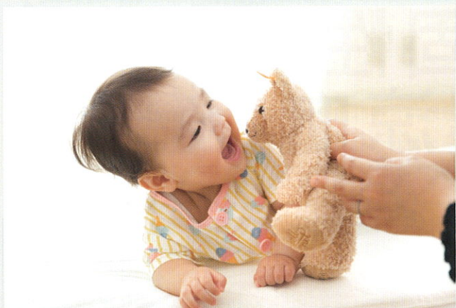
■ 母親孕育小寶寶，一點也不簡單。