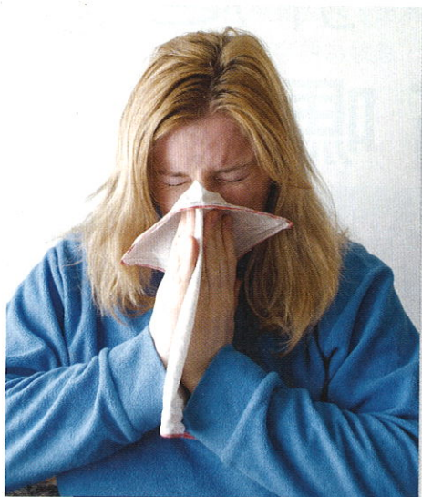
■免疫力出現問題，便會生病。

和組織損傷，引發自身免疫性疾病，導致身體出現病理性衰老，從而加速正常的生理性衰老過程，這就是自身免疫說。