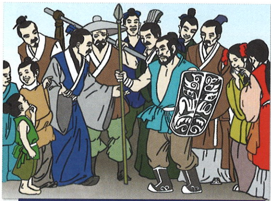
■相信不少讀者都聽過「自相矛盾」的故事。

自身免疫病日漸增多，常見的有惡性貧血（Pernicious anaemia）、風濕熱（Rheumatic fever）、類風濕病（Rheumatoid disease）、腎小球腎炎（Glomerulonephritis）、系統性紅斑狼瘡（Systemic lupus erythematosus），以及包括橋本氏病（Hashimoto's disease）在內的甲狀腺疾病等。隨着自身免疫研究的深入，發現了很多疾病可能亦與此有關，如某些心臟疾病、高血壓、糖尿等。