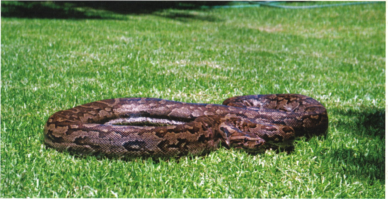
■冬季寒涼宜飲蛇酒，有溫陽散寒的功效。