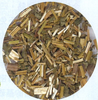
■藿香有化濕解暑及止嘔的功效。

軍，她二人便相依為命，感情甚好。某年夏天，嫂子中暑病倒了，霍香由於平時跟哥哥學了點中藥的知識，於是女扮男裝，上山採藥醫治嫂嫂。霍香去了一整天，令佩蘭掛心不已。直到天黑，霍香才蹣跚地回來，手中提着一籃草藥。一到家門，便支持不住，倒在床上。佩蘭見她的小腿紅腫一片，像給蛇咬傷了，情急之下，用口去吮吸毒血。霍香無力把她推開，哭求佩蘭停止不果，終於二人一起中毒。次日，隣居發現姑嫂二人倒在地上，霍香已氣絕，佩蘭也奄奄一息。她吃力地把事情的經過說出，並指出霍香採得的兩種草藥的功效後，便斷了氣。鄉親們非常感動，先把她兩好好埋葬了，並且記住了那兩種藥。大家為了紀念姑嫂兩人，便稱其中一種為霍香（後來寫成藿香），另一種為佩蘭。