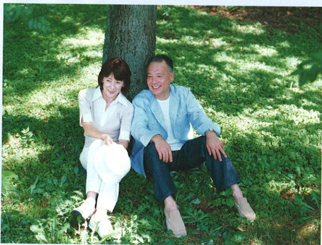
■天氣太熱擔心中暑時，可在樹蔭下休息一會。

(4)日射病： 多發生於夏天烈日下曝曬一段時間後，體溫不一定升高，但出現頭暈、頭痛、目眩、耳鳴、惡心、嘔吐、煩躁不安、甚至昏迷、驚厥等症狀。相當於中醫之暑熱蒙心。