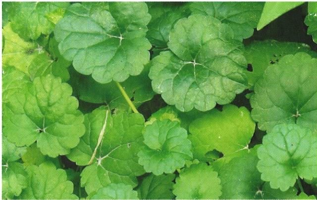
■利尿藥如金錢草對加強尿液排泄重金屬有一定幫助。