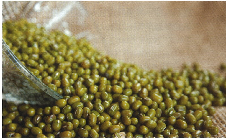
■綠豆對防治某些重金屬的慢性中毒有一定效果。

從表中可見，12種中藥材飲片中，有10種含鎘量均超標，由超標不足一倍至最高11倍多（蟬蛻），有八種藥材兩個批次均超標。蟬蛻的污染最明顯，兩個批次的蟬蛻含砷量及其中一個批次的含鉛量均超標（由一倍多至三倍多）。