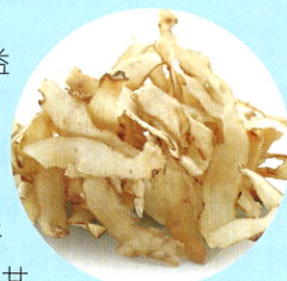
■玉竹有養陰潤燥，生津止渴的功效。

功效： 海參性溫味鹹，能補腎益精，養血潤燥；冬菇性平味甘，能補肝腎，健脾胃，安神益智；玉竹性平味甘，能滋陰潤肺，養胃生津；枸杞子性平味甘，補腎益精，養肝明目；瘦豬肉性平味甘鹹，能滋陰潤燥，補血。本方滋陰潤燥，補腎益精。