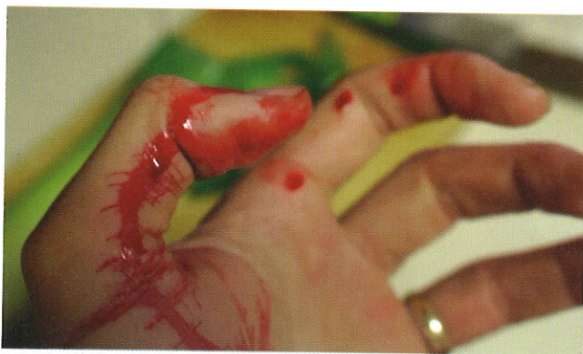
■不同的急慢性出血也會造成血虛。