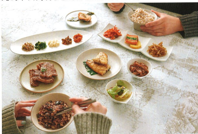
■ 癌症患者飲食既清淡但也要有營養。

早在3500多年前的殷周時代，殷墟甲骨文上已出現有「瘤」的病名，「瘤」即留聚不去的東西。約在3200多年前的《周禮》一書中已有相關記載：「瘍醫下士八人，掌腫瘍，潰瘍、金瘍、折瘍之祝藥刮殺之齊（指具有能去腐肉生新肌的藥劑）；凡療瘍，以五毒攻之，以五氣養之，以五藥療之，以五味調之。」後世醫家也把「腫瘍」注解為聚而不散的病理變化，而瘍醫則相當於外科醫生。兩千多年前的《黃帝內經》奠定了中醫腫瘤學形成與發展的基礎，《靈樞·百病始生篇》云：「虛邪之中也……留而不去，則傳舍於絡脈……。」留者，瘤也，日久則傳舍或留著於各處，此為中醫對轉移腫瘤疾病的最早記載。