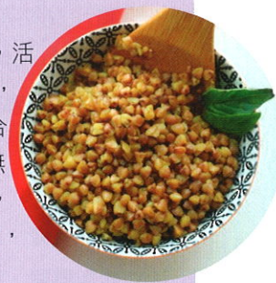
■ 金蕎麥能清熱解毒，健脾利濕。

功效：金蕎麥性涼味微苦，能清熱解毒，活血化癥，健脾利濕；南芪性微溫味甘，能健脾化濕，行氣止痛，除痰止咳；百合性微寒味甘，能潤肺止咳，寧心安神；無花果性平味甘，能健脾開胃，潤肺利咽，潤腸通便，消腫解毒。本湯具清熱解毒，活血化癥，健脾化濕功效。