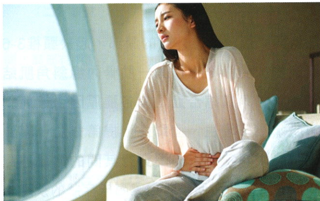
■ 《黃帝內經》所記載的「癥瘕/積聚」，跟現代的腹腔惡性腫瘤相似。

於女子。」這石瘕的症狀與子宮內的腫瘤相類似：「腸覃者……如杯子之狀……按之則堅。」這描述與腹腔內的某些腫瘤相似：「三陽結謂之膈。膈塞閉絕，上下不通。」與食道、贛門的腫瘤造成的梗阻相一致：「飲食不下，膈塞不通，邪在胃脘。朝食暮吐，暮食朝吐，宿穀不化……其病難治。」與胃癌相一致等。