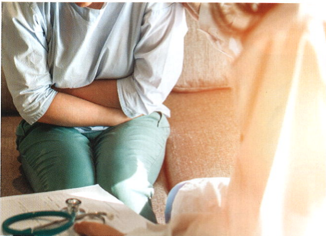
■ 癌症患者切忌盲目求醫，走入誤區。

「癌」字並非是惡性腫瘤或癌症，而是指「無頭疽」，一種屬於深部膿腫之癰疽。至於以岩（癌）作為癌症的病名，也始見於宋代醫家，楊士瀛著的《仁齋直指附遺方論》（公元1264年）中有關的論述：「癌或上高下深，岩穴之狀，顆顆累贅……毒根深藏，穿乳透裡，男則多發於腹，女則多發於乳或項或肩或臂，外症令人昏迷。」往後的古籍中，亦有不少醫書以「岩」或「癌」之名，如宋代陳自明在其《婦人大全良方》首先明確提到「乳岩」；元代的朱丹溪在其《丹溪心法》中也論述乳癌；明代的陳實功在其《外科正宗》中詳細論述乳癌。總之，宋元以來，醫家對癌症有直稱為「癌」者，亦有以「岩」立名，如「乳岩」、「腎岩」、「舌岩」等，亦有不用「癌」，或「岩」命名者，如「失榮」（發生於頸部，耳後的癌腫，包括惡性淋巴瘤或頸部的轉移癌）、「繭唇」（唇癌）、「舌菌」（舌癌）、「五色帶下」（子宮頸癌、陰道癌、子宮內膜癌）等。