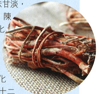
■ 五指毛桃有健脾祛濕的功效。

功效： 南芪（五指毛桃）性微溫味甘辛，能健脾化濕，行氣止痛，除痰止咳；白芨性寒味苦、甘、澀，能收斂止血，消腫生肌，藥理研究顯示白芨對胃及十二指腸黏膜損傷有明顯修護作用；生薏仁性微寒味甘淡，能利水滲濕，健脾除痹，排膿消癰；陳皮性溫味辛苦，能理氣健脾，燥濕化痰，降逆止嘔；豬瘦肉性平味甘鹹，能滋陰潤燥，補血；蜜棗性平味甘，能補益脾胃，潤肺除痰，滋養陰血，養心安神，緩和藥性。本湯具健脾化濕，排膿消腫功效，有助修復胃及十二指腸黏膜損傷。