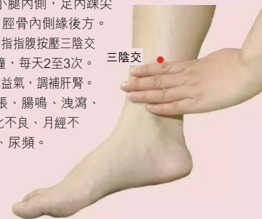
■按摩三陰交有健脾補肝腎的功效。

功效： 健脾益氣，調補肝腎。 主治： 腹脹、腸鳴、洩瀉、便秘、消化不良、月經不調、遺尿、尿頻。