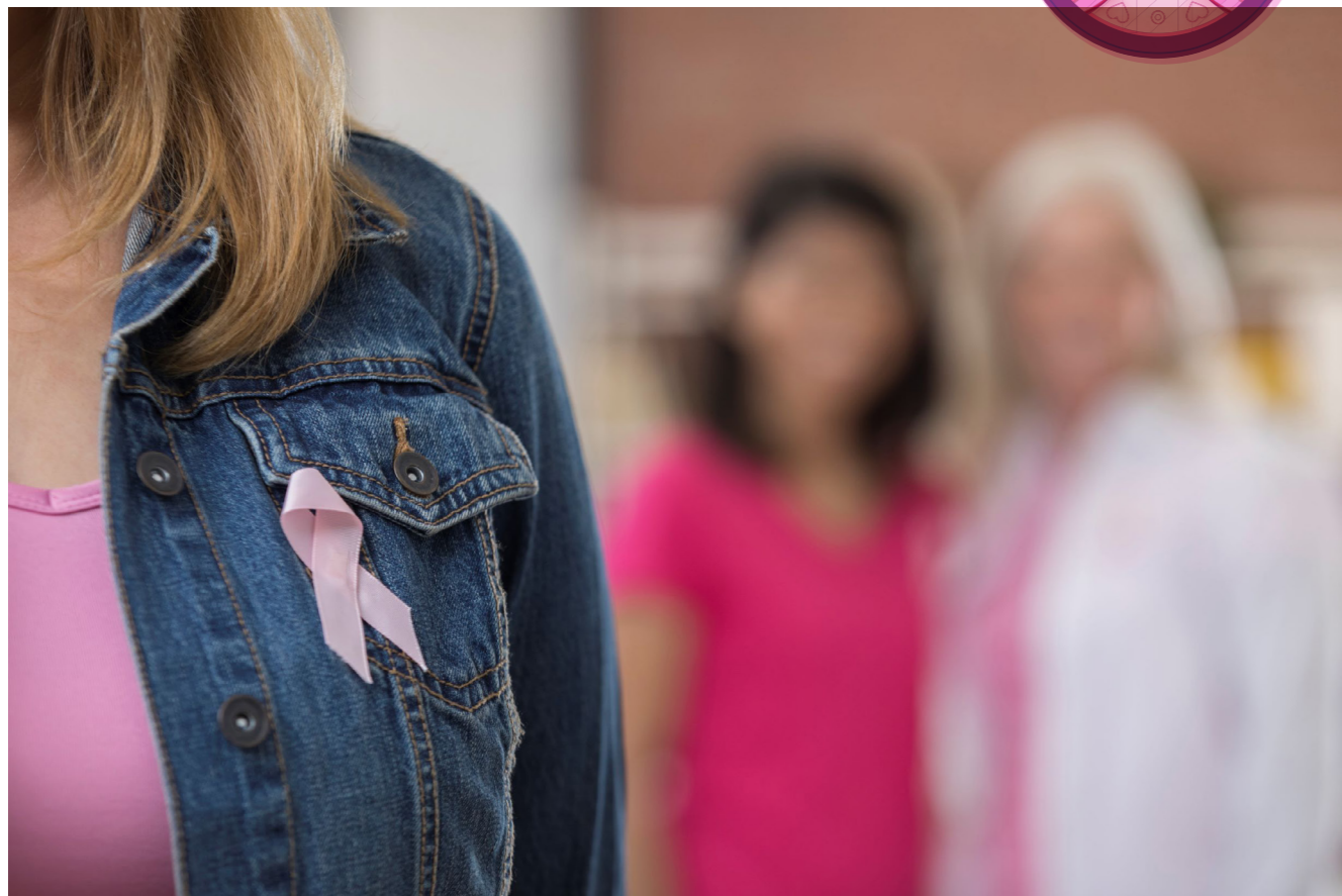
■將乳癌患者乳房組織包括附近淋巴組織全部切除的治療方法，一直沿用了七十多年。

上月文章談論西方醫學的癌字即「cancer」的起源，本篇簡單概括地論述現代醫學認識癌症的發展史。