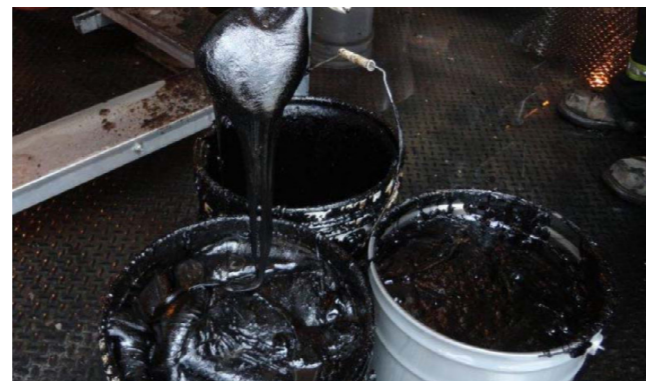
■早於1775年有醫生已發現長期接觸煤煙和焦油等致癌物質可致睪丸癌。

工人中相當普遍，可能和長期接觸煤煙和焦油等致癌物質有關。這是世界上最先發現癌症誘因的個案。